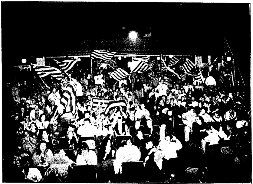
Panorámica del Teatro Goya de Caspe.

La comida estaba programada para celebrarla en el club náutico. Todos los participantes nos dirigimos a las instalaciones. Hubo que realizar un pequeño paseo para alcanzar el lugar de la comida. Nos dirigimos hacia él en pequeños grupos. En un momento, el club se llenó de todo tipo de gente que comían en mesas o en las propias orillas del pantano. Lo más difícil del día fue el conseguir tomar un café. Las filas y la espera se hicieron largas. La excursión de vuel-