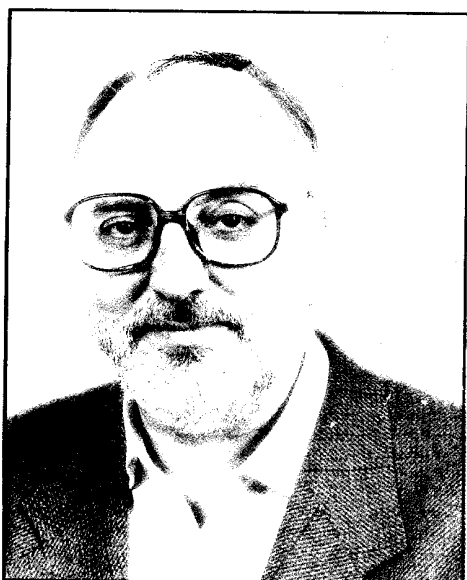
Gonzalo Borrás, candidato a la alcaldía de Zaragoza