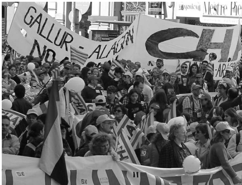
Imágenes de la manifestación de Barcelona.

dente castellano-manchego, dejó en ridículo a Iglesias y a la treintena de alcaldes y dirigentes del PSOE aragonés y del PAR que acudieron a Bruselas a convencer a los liberales, cuando deberían primero haberse esforzado en convencer a los propios.