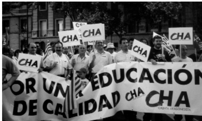
Manifestación en Zaragoza por una educación de calidad.

La necesidad electoral del PAR de mostrar su fuerza imponiendo su programa a un Departamento en manos del PSOE ha provocado finalmente la ruptura del brevísimo pacto de gobierno tripartito con IU (y la enésima crisis interna en esta organización, al conservar sus car-