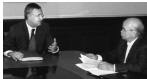
Labordeta con el ministro de Trabajo y Asuntos Sociales, Jesús Caldera.

El diputado Labordeta y el Ministro de Asuntos Sociales se reunieron el pasado 2 de noviembre para intercambiar opiniones sobre el nuevo Reglamento de la Ley de Extranjería, donde CHA ha expresado la necesidad de cambios legislativos para fomentar la integración.