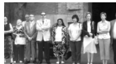
Concentración silenciosa contra la violencia de género, convocada por Acción Social del Ayuntamiento de Zaragoza.

El Rolde de Igualdad propone también el reconocimiento especial para las empresas que faciliten trabajo a las mujeres maltratadas, la creación de espacios públicos como punto de encuentro vigilado entre la mujer maltratada y el agresor a la hora de entregar y recoger a los hijos cuando el agresor conserve el derecho al régimen de visitas, o la creación de un Fondo de Garantía para aquellas mujeres víctimas de violencia que dependen económicamente del agresor.