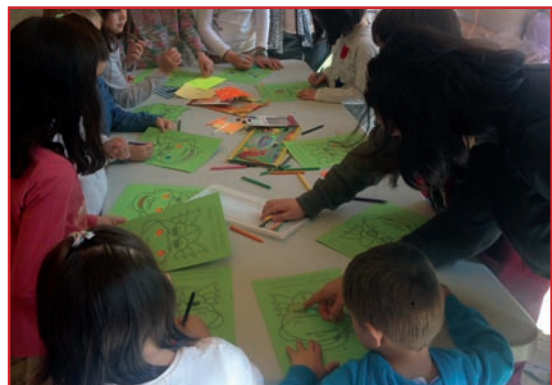
Actividades en Sarrión el Día de Aragón.

En su ánimo por mejorar el funcionamiento de la institución y plantear ideas, desarrollan todos los años un particular evento en San Jorge con el que intentan dinamizar la festividad del patrón de Aragón; un "Día de CHA-Sarrión" con un concurso de gachas y actos en torno al 8 de marzo.