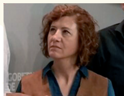
La turolense Marisa Romero es la actual directora general de Turismo del Gobierno de Aragón.

Del trabajo de estos equipos se hacen eco constantemente los medios de comunicación, destacando las acciones de vertebración ferroviaria y de carreteras, la nueva política turística, la lucha contra la despoblación, el acceso a la vivienda o el asesoramiento a pequeños municipios en temas urbanísticos.